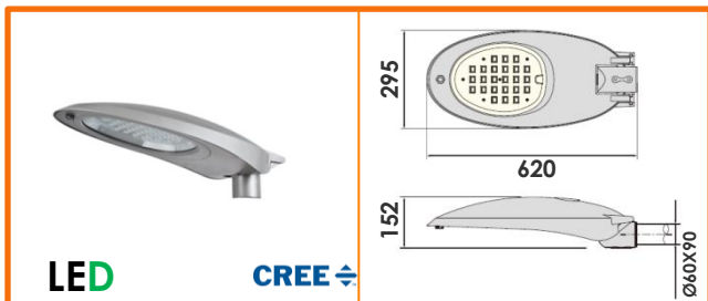
LUMINARIA RADIAL D-150S