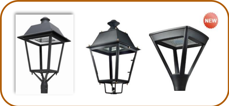
GALAXY ECOVILLA DELTA T-70N