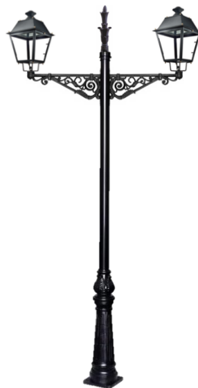
Conjunto 2: Columna Cartuja Con 2 Brazos Villa+ 2 Farol Villa Y Remate Superior Tipo Lanza.