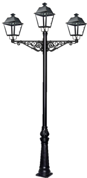
Conjunto 1: Columna Cartuja Con 2 Brazos Villa+ 3 Farol Villa