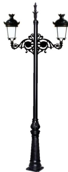
Conjunto 4: Columna Cartuja Con 2 Brazos Fernandino Aluminio+ 2 Farol EcoFernandino 850m/m+Remate.