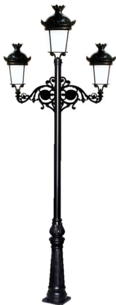
Conjunto 3: Columna Cartuja Con 2 Brazos Fernandino Aluminio +3 Farol EcoFernandino 850m/m