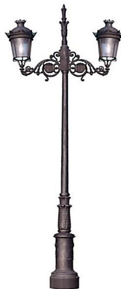
Conjunto 2: Columna Fernandina 4,15mts. Con 2 Brazos Fernandino+ 2 Farol Ecofernandino+Remate Superior Lanza.