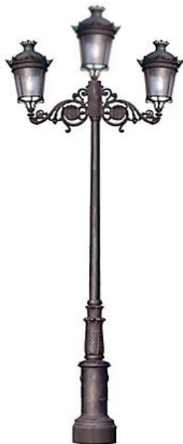
Conjunto 3: Columna Fernandina 4,15mts Con 2 Brazos Fernandino Aluminio +3 Farol Fernandino 850m/m.